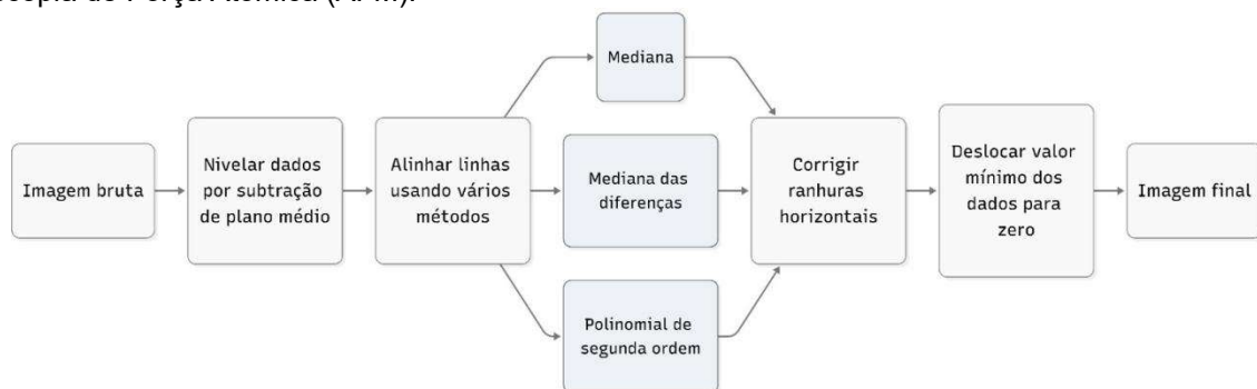
Figura 1: O fluxograma representa o procedimento de pós-processamento aplicado às imagens obtidas por Microscopia de Força Atômica (AFM).

Subsequentemente as imagens foram analisadas com auxílio de diferentes inteligências artificiais (Gemini, ChatGPT, DeepSeek, Microsoft Copilot e Claude), utilizando prompts padronizados para garantir imparcialidade. Observou-se que o DeepSeek apresentou limitações, não conseguindo interpretar imagens sem texto ou contexto, enquanto ChatGPT, Gemini e Claude realizaram análises diretamente a partir de imagens TIFF. Inicialmente, utilizou-se o formato TIFF pela sua maior qualidade, mas, como o Copilot não o suporta, os testes foram adaptados para PNG, que apresentou resultados semelhantes. Assim, padronizou-se o uso de PNG para melhor comparação.